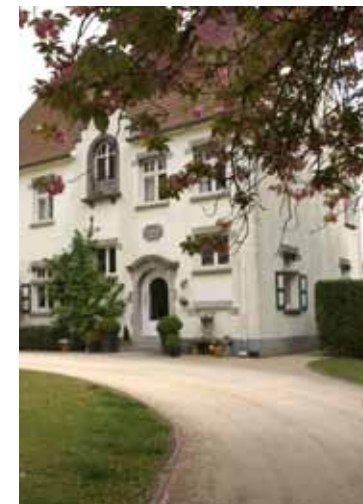
B&B La Mine Coline, Genk

Combineer een bezoek aan Manifesta 9 en C-mine met een verblijf in Genk, de stad beschikt over een variëteit aan kwaliteitsvolle hotels gaande van een designhotel tot golfhotel en jeugdherberg. Ook op culinair vlak laat Genk je alle hoeken van de wereld ontdekken, je kunt er genieten van de eenvoudige heerlijkheden van de talrijke multi-culturele restaurants of je gastronomisch laten verwennen in een toprestaurant. Genk is bovendien een goede uitvalsbasis voor een bezoek aan andere interessante steden zoals Maastricht (20 km) en Hasselt (15 km). www.uitingenk.be