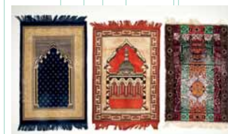
Turkse Unie, bidmatjes van de eerste generatie Turkse immigranten, jaren 1950-1960.