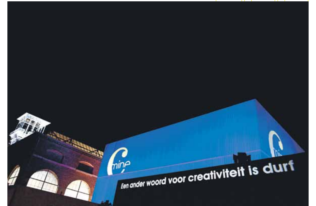
C-mine: creativiteit is een ander woord voor durf

Met 'Manifesta 9 meets C-mine' creëert Genk deze zomer een boeiend belevingsaanbod, een artistieke confrontatie, die onder andere via The Machine ook linken legt naar de nieuwe maakindustrie. En dat alles samengebracht in indrukwekkend monumentaal industrieel erfgoed.