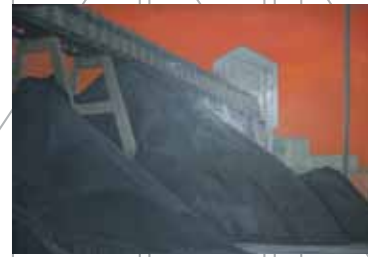
Janet Buckle, Hatfield: A Working Colliery © Janet Buckle

Janet Buckle geb. 1945, South Yorkshire, Groot-Brittannië; woont en werkt in Doncaster, Groot-Brittannië.