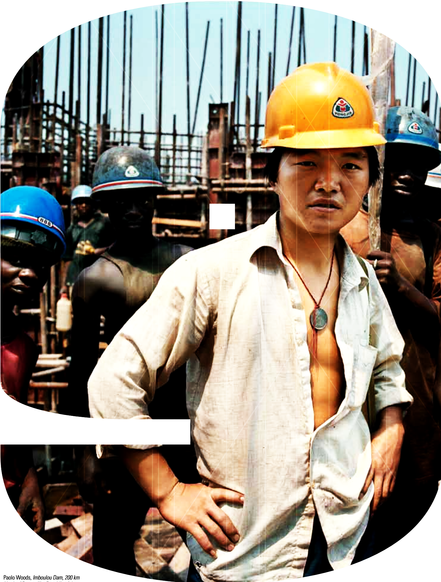
Paolo Woods, Imboulou Dam , 200 km North of Brazzaville, Republic of the Congo, juni 2007

2 juni – 30 september 2012 Genk, Provincie Limburg, België