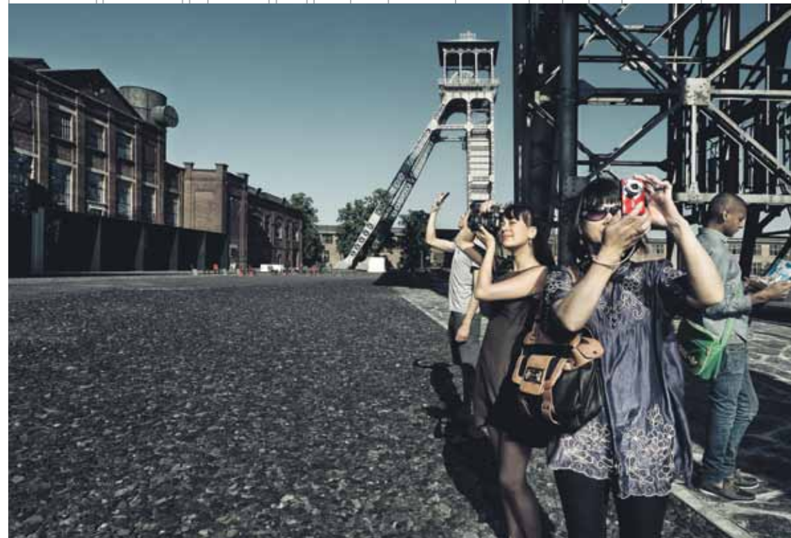
C-mine expeditie

Praktisch: C-mine expeditie kun je tot november bezoeken van dinsdag tot zondag van 10u tot 17u. C-mine is vrij toegankelijk, het toeristische bezoekersonthaal is open alle dagen van 10u-17u, maandag 13u-17u. Meer info: C-mine bezoekersonthaal, C-mine 10 b2, 3600 Genk, tel 0032 89 65 44 90 – c-minebezoekersonthaal@genk.be – www.c-mine.be