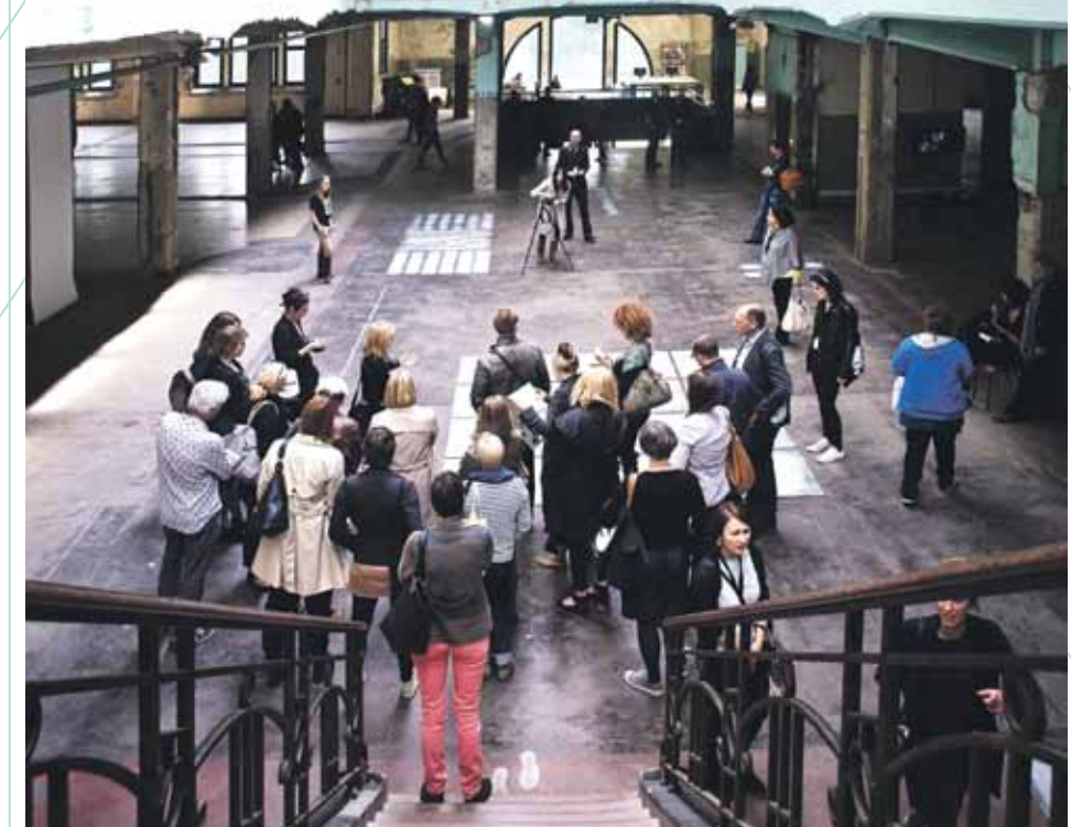
Voormalige mijn Waterschei, Genk.