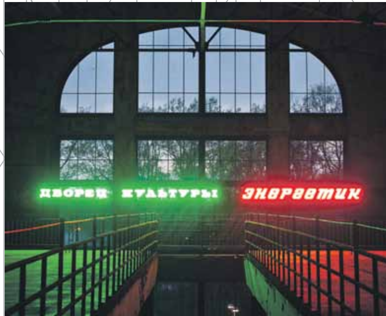
Claire Fontaine, The House of Energetic Culture , 2012, © de kunstenaars.

Claire Fontaine Sinds 2004, Parijs, Frankrijk; woont en werkt in Parijs, Frankrijk.