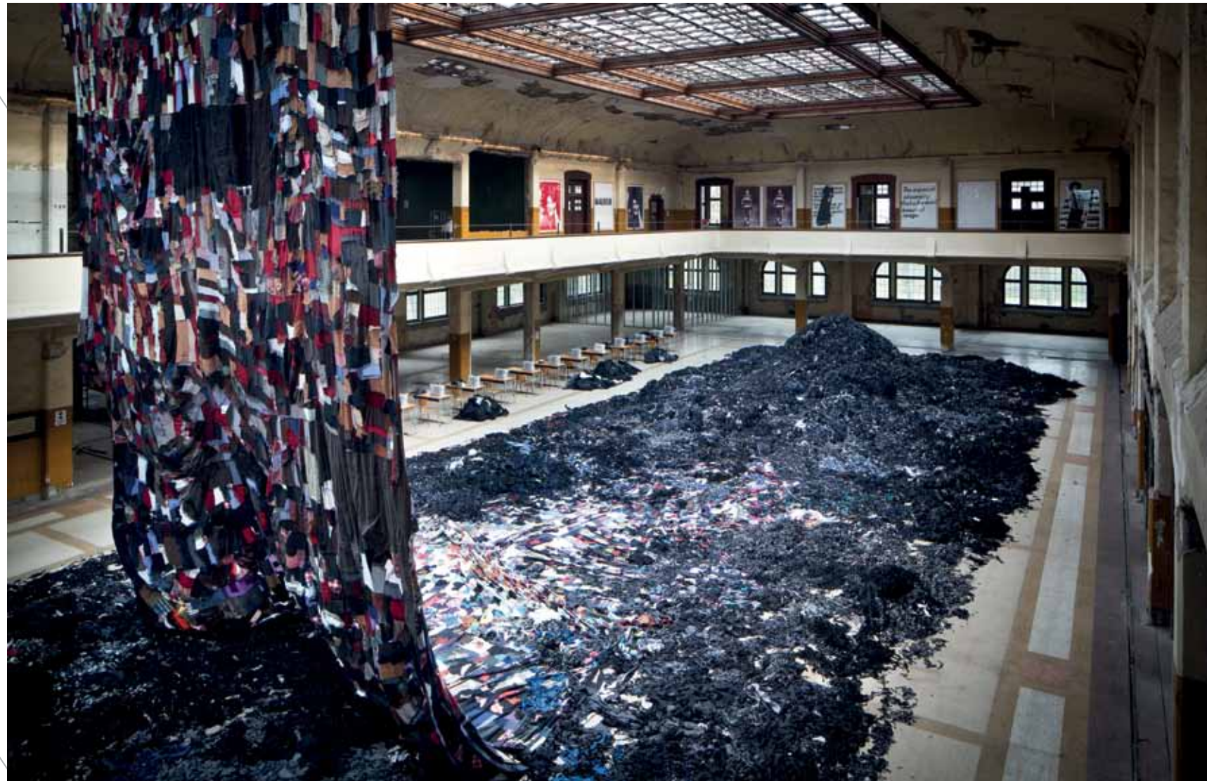
Ni Haifeng, Para-Production , 2012

Ni Haifeng geb. 1964, Zhoushan, China; woont en werkt in Amsterdam, Nederland