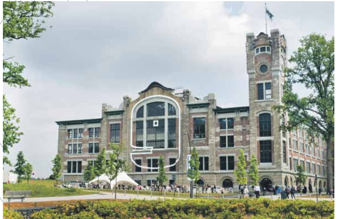
Voormalige mijn Waterschei, Genk.