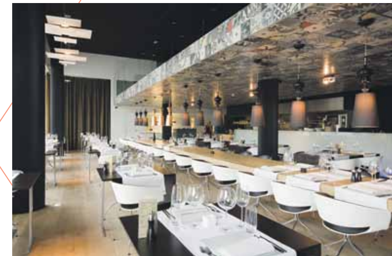
Hotel Carbon, Genk